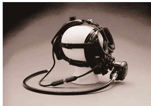
图 8 DIVELINK Model COM-FFS SCUBAPRO 型水下语音通信机 [45] Fig.8 DIVELINK Model COM-FFS SCUBAPRO frogman underwater voice communicator [45]