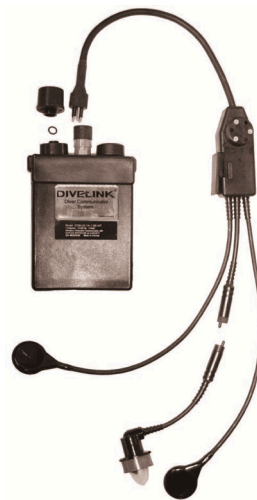
图 4 Model COM-UC-8-10/20-SE-VOX 型水下语音通信机 [9] Fig.4 Model COM-UC-8-10/20-SE-VOX frogman underwater voice communicator [9]

也进行了深入的研究探索，早在 1997 年，国外学者就将数字技术引入到水声语音通信系统中 [10] ，提出采用数字信号处理器(Digital Signal Processing, DSP)来实现数字水下语音信号处理和传输的方法，并成功地测试了通信系统。SARI H 等 [11] 提出了一种新的数字水声语音通信技术，利用线性预测编码对语音信号进行压缩，并通过数字脉冲位置调制，实现合适的语音参数的传输。ÖKTEM 等 [12] 提出了一种采用正交频分复用(Orthogonal Frequency Division Multiplexing, OFDM) [13-14] 作为扩频技术的水下语音通信系统，主要研究了应用层、数据链路层和物理层，分析可实现的数据速率和性能。该系统采用的自适应通信参数将提供最多 16 个用户间的语音在同一时间使用整个频段的通信。REN H P 等 [15] 提出了一种新的低信噪比混沌扩频蛙人用水