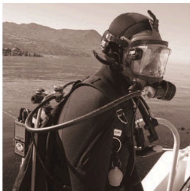
图 2 OTS Aquacom SSB-2010 型水下语音通信机 [7] Fig.2 Model OTS Aquacom SSB-2010 frogman underwater voice communicator [7]