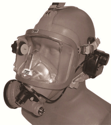
图 7 OTS Buddy-Phone-2-on-mask 型水下语音通信机 [44] Fig.7 Model OTS Buddy-Phone-2-on-mask frogman underwater voice communicator [44]

在水下语音通信机结构组成方面，也由之前的分体式、大体积向模块化、小型化、低功耗和一体化发展，如图 7 和图 8 所示。其中，图 7 为 OTS Buddy-Phone-2-on-mask 型水下语音通信机 [44] ，通信机和全面罩一体化设计，通信机本体置于全面罩侧面，采用干电池供电。图 8 为 DIVELINK Model