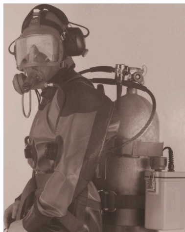
图 3 Diver Unit 1080VOX 型水下语音通信机 [8] Fig.3 Model Diver Unit 1080VOX frogman underwater voice communicator [8]