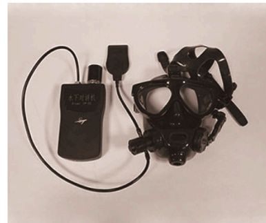
图6 苏州桑泰型水下语音通信机 [35] Fig.6 Model Suzhou Santai frogman underwater voice communicator [35]