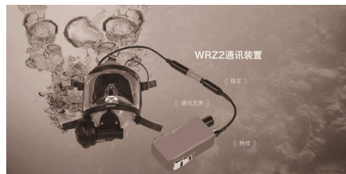
图5 WR22型水下语音通信机 [34] Fig.5 Model WR22 frogman underwater [34]

合自适应增量调制技术 [32] ,基于以上技术先后研制了第1代和第2代水声语音通信样机,其中第1代水下语音通信样机进行了多次海上测试实验,可达到7500m左右的稳定通信距离;第2代水下语音通信样机对第1代做了优化改进,加入了信道纠错编码技术,在容错能力、系统的鲁棒性等方面都有明显增强,多次海上测试都达到了10000m左右的稳定通信距离 [20] 。昆明五威科工贸有限公司采用文献[33]中的数字单边带调制技术,研制了WR22水下语音通信机 [34] (如图5所示),已成功装备某水下航行器,采用半双工通信方式,最大通信距离约1000m,最大工作深度为30m,待机时间达10h。苏州桑泰海洋仪器研发有限责任公司开发的水下语音通信机 [35] (如图6所示),采用PPT(键控)或VOX(声控)两种发射控制方式,2个信道,传输距离达1500m,最大工作深度为60m。